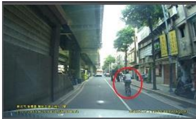
圖 2 自行車騎士閃避前方大貨車的潛在風險

以下情境場景例子，可幫助駕駛人了解行駛在車多擁擠的道路上，在車道右邊前方出現一自行車騎士，之後又在車道前方右手邊發現一輛大貨車路邊停車。當駕駛人接近自行車騎士時，自行車騎士正要騎進車道中以閃避前方大貨車，自行車騎士做了一回頭巡視的動作（如圖 2 所示），此時駕駛人必須放慢速度來預防與確保自行車騎士的安全。當碰到此種狀況，駕駛人必須有下列思維：「自行車騎士很有可能為了閃避大貨車而沒有固定行向，我很有可能會追撞自行車騎士，我要採取閃避行為」。因此，駕駛人必須觀察發展中的潛在風險，同時要發現到該風險。稍後自行車騎士做了一個回頭掃視的動作，因此很有可能會騎進中間車道，受測者非常接近自行車騎士，要準備做閃避措施以避免追撞自行車騎士，最後「自行車騎士騎進車道，駕駛人應該要放慢速度」。