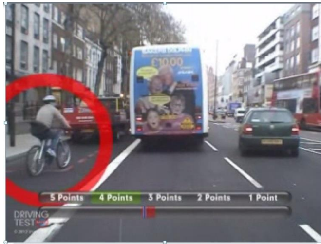
圖 1 英國危險感知測試方式