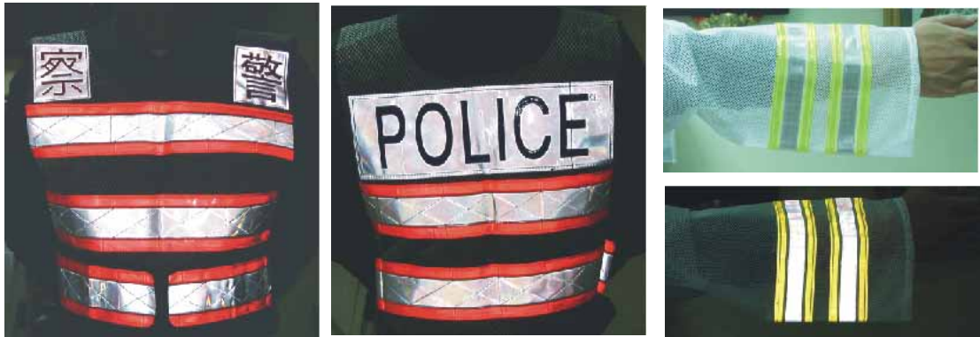
雙色反光材料於服裝之應用